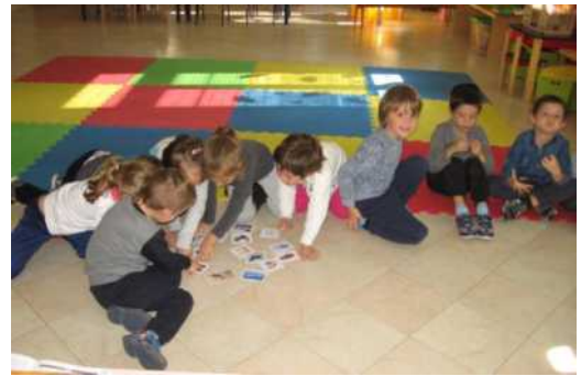
Bambini di 5 anni

I bambini ascoltano i rumori, i suoni e li associano all'immagine.