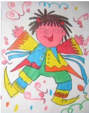
Il diavoleto rumore