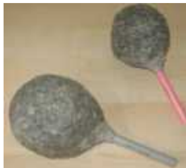
Costruiamo le maracas