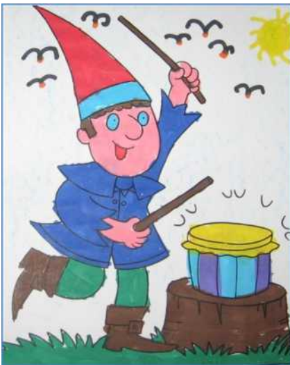
Gnomo battente e il tamburo