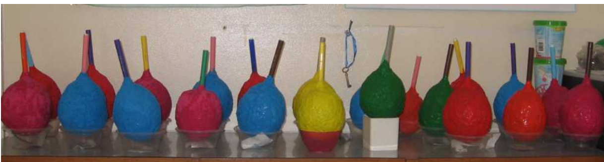
Le maracas sono pronte