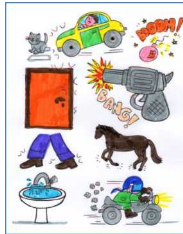
Coloro e riconosco questi rumori

Gioco: Ascoltiamo dal CD e indoviniamo i rumori. Impariamo il canto: Bambini e rumore.