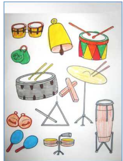
Conosciamo alcuni strumenti